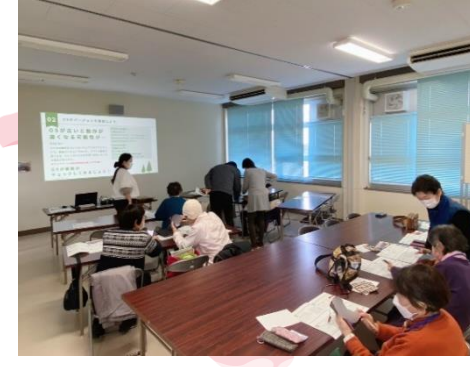
2023.12 センター主催のスマホ講座