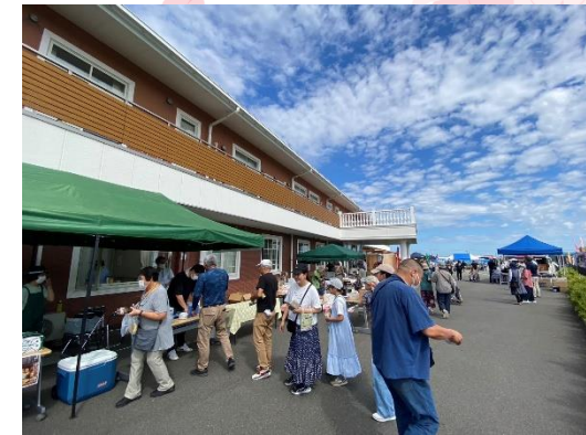
2023.9 夢プラザマルシェが他施設と 初コラボ！