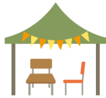
ハンドメイド などの作品