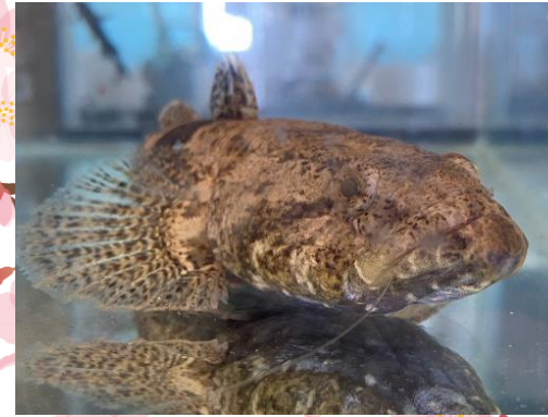
2023.10 つながる展示会 桜の園の会さんの大人気どんこちゃん