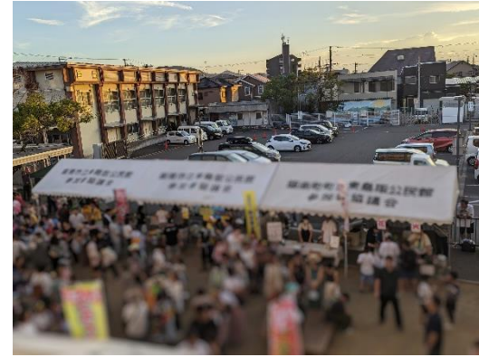
2023.8 大盛況！みなで夜店