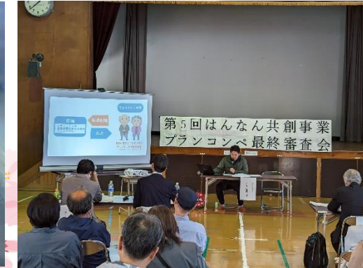
2023.11 第5回はんなり共創事業 プランコンペ