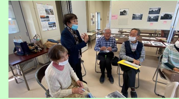
井戸端会議α(アルファ)