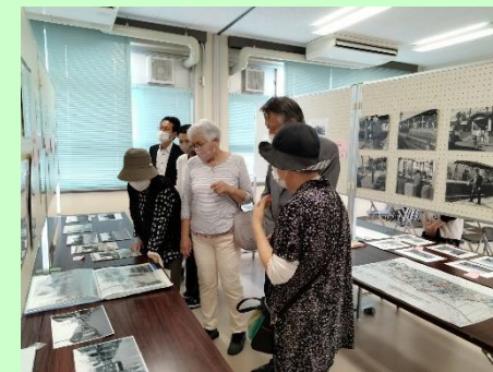
阪南ノスタルジー