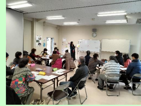
つながる大交流会