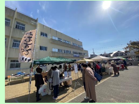
夢プラザマルシェ